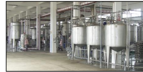
油脂与蛋白装备与工程