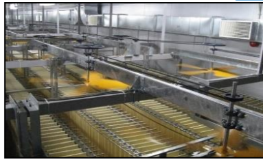
肉食加工装备与工程