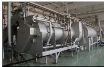
薯类和淀粉装备与工程